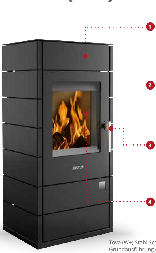
Tova (W+) Stahl Schwarz, Grundausführung (ohne W+)