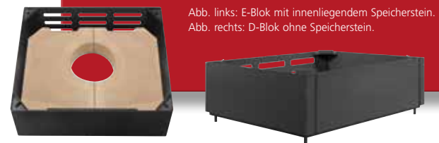
Abb. links: E-Blok mit innenliegendem Speicherstein. Abb. rechts: D-Blok ohne Speicherstein.

Um bis zu 3 zusätzliche Segmente (E-Blok oder D-Blok) erweiterbar. Höhe: 147 mm je E-Blok