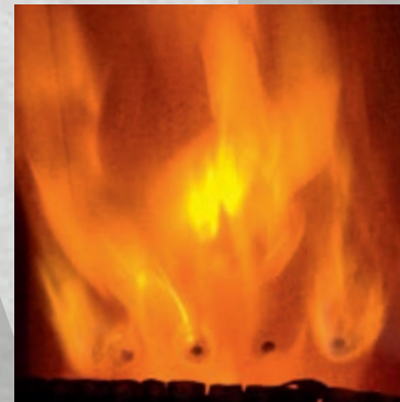
Tertiärluft wird durch Düsen im hinteren Brennraumbereich „eingebblasen“

Zusätzlich oder parallel zur Sekundärluft wird den Brennräumen mancher Öfen noch Tertiärluft durch spezielle Düsen im hinteren Brennraumbereich zugeführt. Dies dient einer weiteren Verbesserung der Vermischung von Brenngas und Luft in der Vollbrandphase.