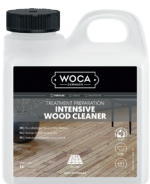
Intensivreiniger Nettoyant intensif Intensiv wood cleaner

The oil care refreshes the parquet and provides a dirt resistant layer.